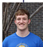
No hay tiros exteriores