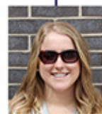
Sin lentes de sol