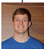
Sin fondo que no sea blanco